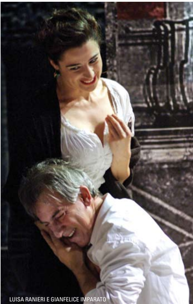
LUISA RANIERI E GIANFELICE IMPARATO